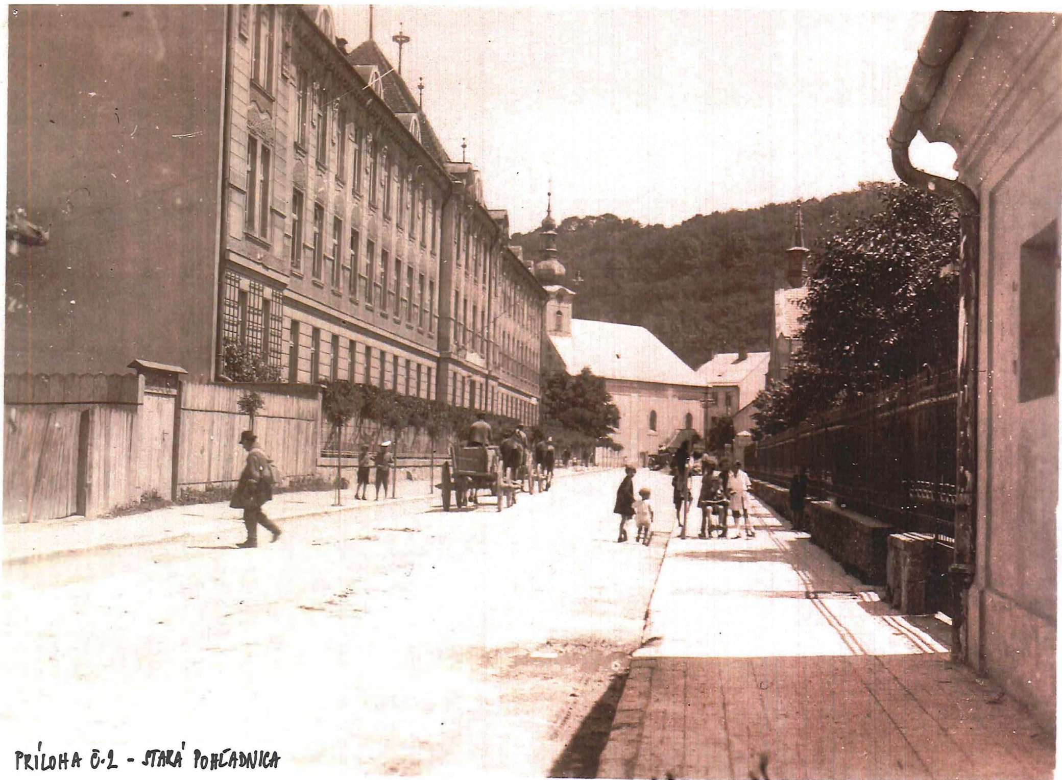
PRÍLOHA Č. 2 - STARÁ POHĽADNICA