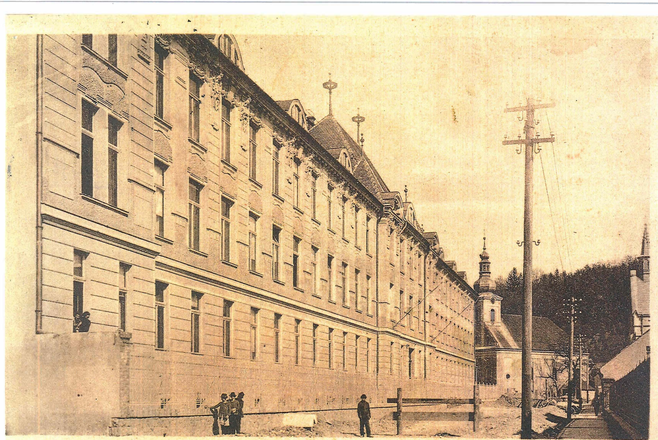
Trencsén. All. felsőbb leányiskola.