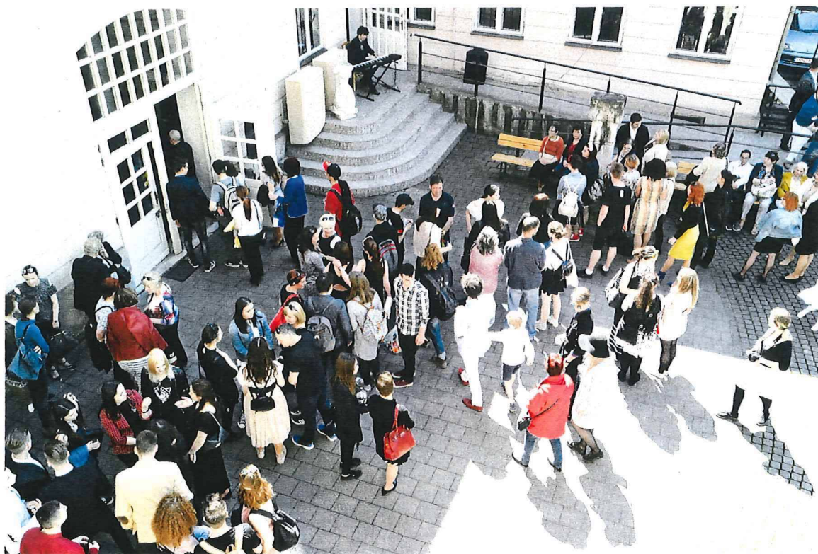
vernisáž Strednej umeleckej školy v Trenčíne na nádvorí galérie