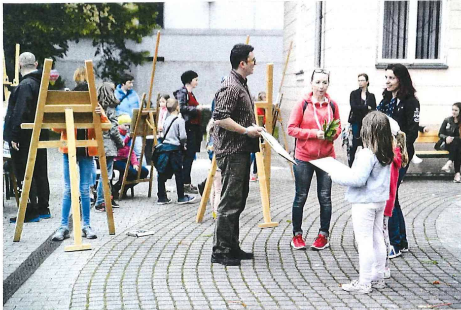
nádvorie využívané na hry počas Noci múzeí a galérií - plenér