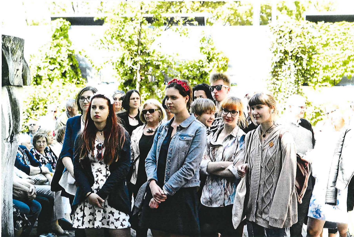
vernisáž Strednej umeleckej školy v Trenčíne na nádvorí galérie