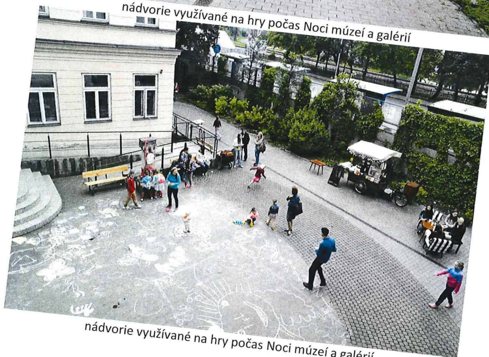
nádvorie využívané na hry počas Noci múzeí a galérií