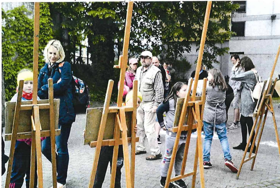
nádvorie využívané na hry počas Noci múzeí a galérií - plenér