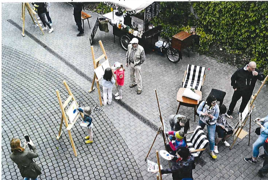
nádvorie využívané na hry počas Noci múzeí a galérií - plenér