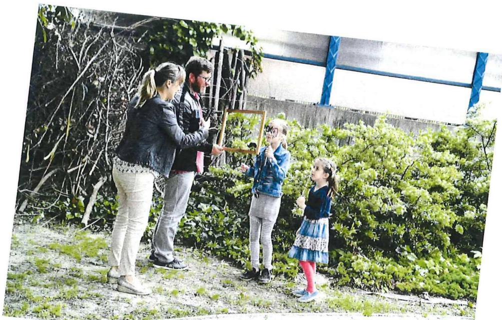
nádvorie využívané na hry počas Noci múzeí a galérií - fotokútik