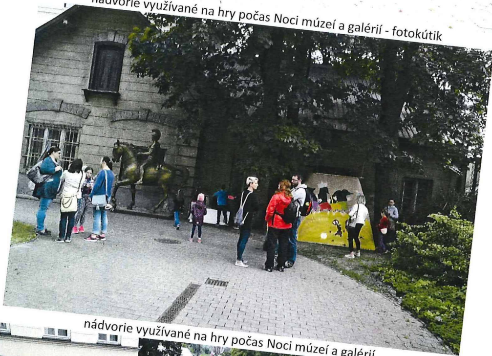
nádvorie využívané na hry počas Noci múzeí a galérií