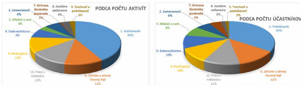
Obrázok 1 Percentuálne vyjadrenie plnenia Koncepcie rozvoja práce s mládežou

Najviac aktivít s najväčším počtom účastníkov zorganizovalo Krajské riaditeľstvo Policajného zboru v Trenčíne (KR PZ v TN), ktoré aktivity realizovalo v 8 okresoch Trenčianskeho kraja. Podľa počtu aktivít nasleduje KCVČ – Regionálne centrum mládeže Trenčín, ktoré spolupracovalo na aktivitách s viacerými mestami ako Trenčín, Púchov, Považská Bystrica, Prievidza, Trenčianske Teplice, Dubnica nad Váhom a i. Z hľadiska počtu účastníkov uskutočnila druhý najvyšší počet Rada mládeže Trenčianskeho kraja.