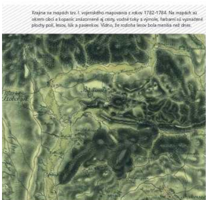
Krajina na mapách tzv. I. vojenského mapovania z rokov 1782-1784. Na mapách sú okrem obcí a kopanic znázornené aj cesty, vodné toky a výmole. Farbami sú vyznačené plochy pastí, lesov, lík a pasienkov. Vidno, že rastlina lesov bola menšia než dnes.