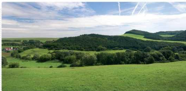
Dnešná podoba krajiny kopaničiarskeho kraja je z veľkej časti výsledkom činnosti generácií obyvateľov, ktorí v priebehu storočí kľčovaním lesov získavali poľa, pasienky a lúky.