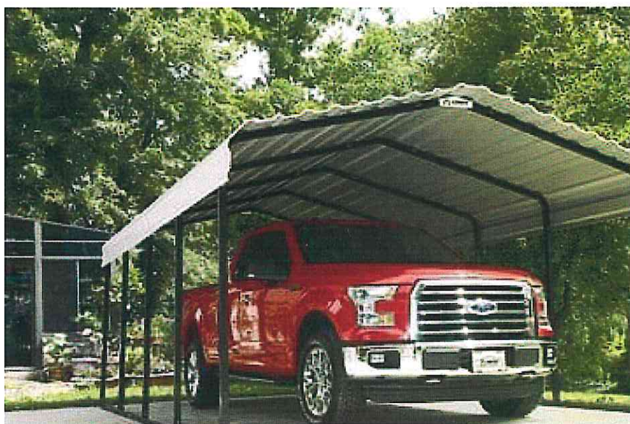
Obrázok 1 Prístrešok ARROW 3,7 x 6,0 na parkovanie vozidla

Mobilný prístrešok bude zabezpečovať chránené parkovanie pre vozidlo CSS – DOMOV JAVORINA s ochranou pred nepriaznivým počasím. Konštrukcia typizovaného mobilného prístrešku ARROW je na obrázku 1.