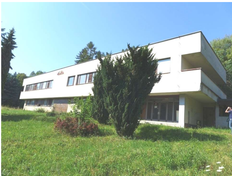
Pavilon mikrobiológie s.č. 712 na p.č. 1137 mesto Myjava – súčasť areálu nemocnice s poliklinikou