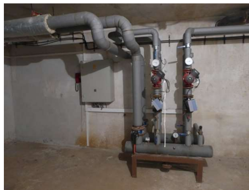
Priestory výmeníkovej stanice - suterén