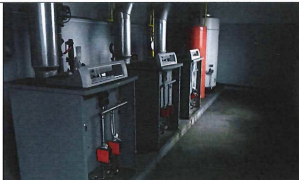
Kotolňa v sociálnej budove