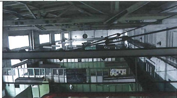
Dielňa vstup a prístavba z roku 1956