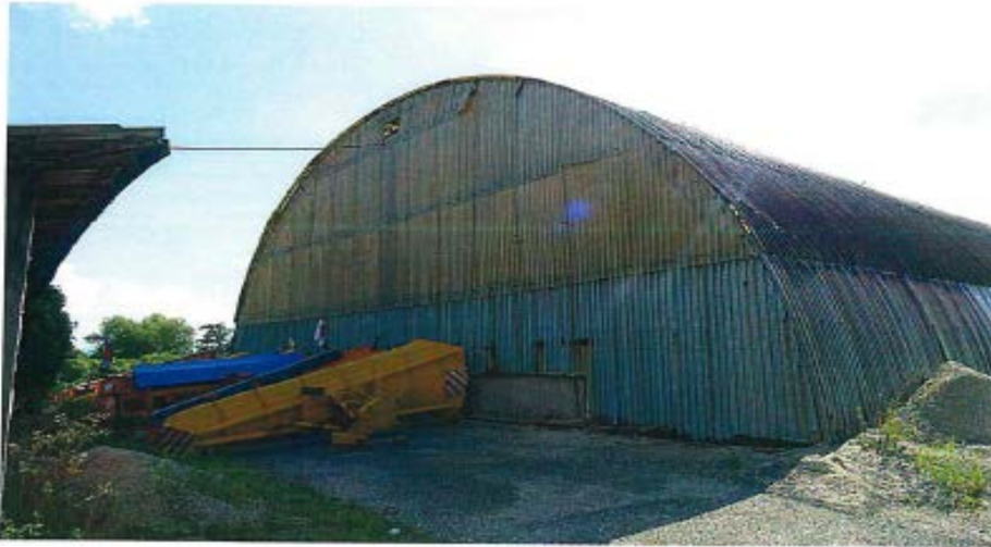
Obr. č.2 Pohľad čelný /sklolaminátová krytina, spodná časť steny – trápezový plech/