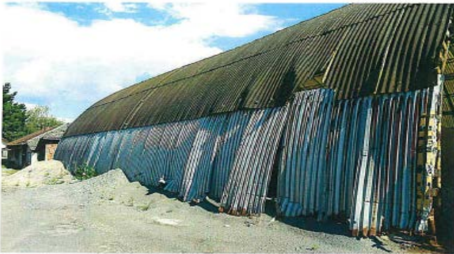
Obr.č.3 Pohľad zadný, pohľad na opláštenie skladu