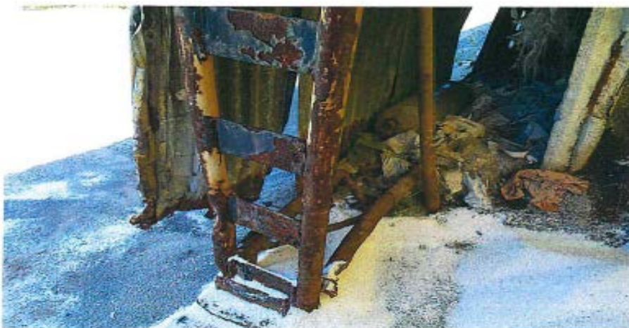
Obr.č.4 Detail nosnej konštrukcie skladu pri kotvení /korózia, deformácie/