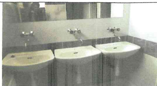
Hygienické zázemie 3x