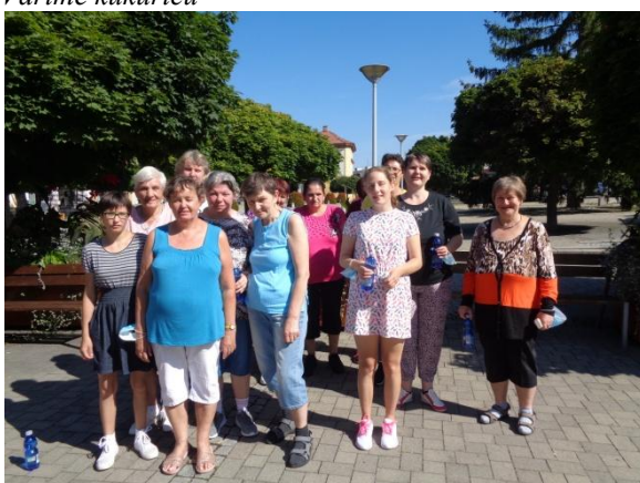
Výlet v Novom Meste nad Váhom