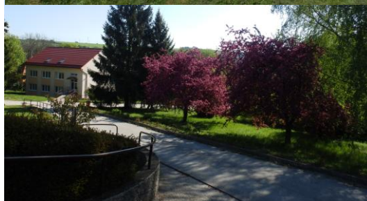
Exteriér CSS – Jesienka Myjava