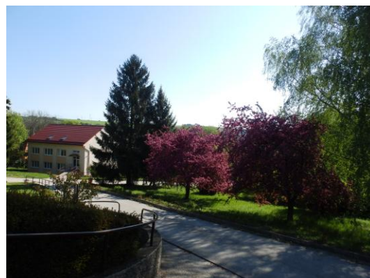
Exteriér CSS – Jesienka Myjava