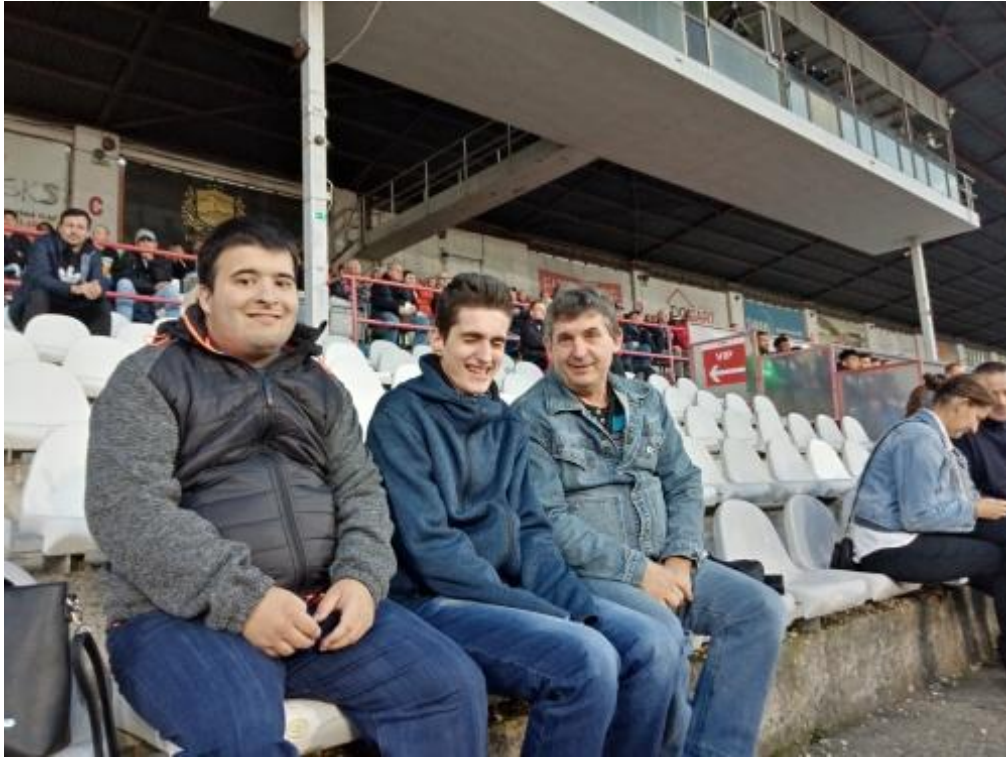
Trenčiansky Omar 2022