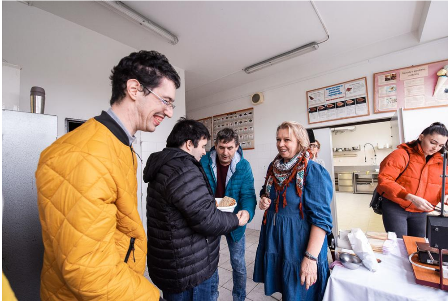
Vianočné trhy na TSK – december 2022