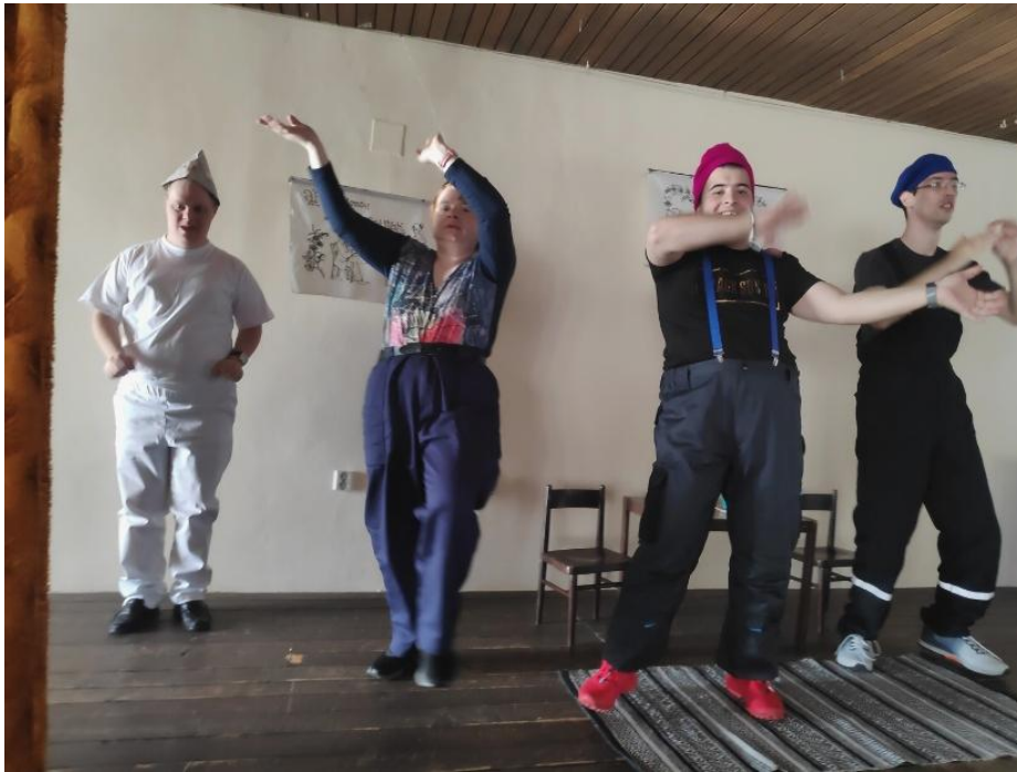
Október 2022 „Na krídlach anjelov“ Žiar nad Hronom