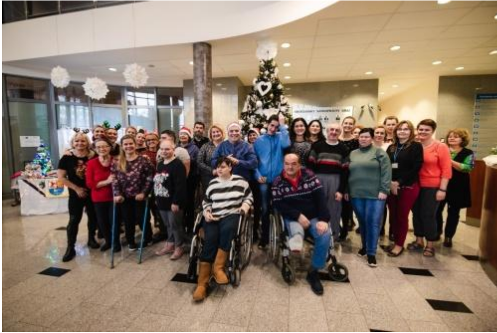
Vianočné posedenie 2022 s príbuznými