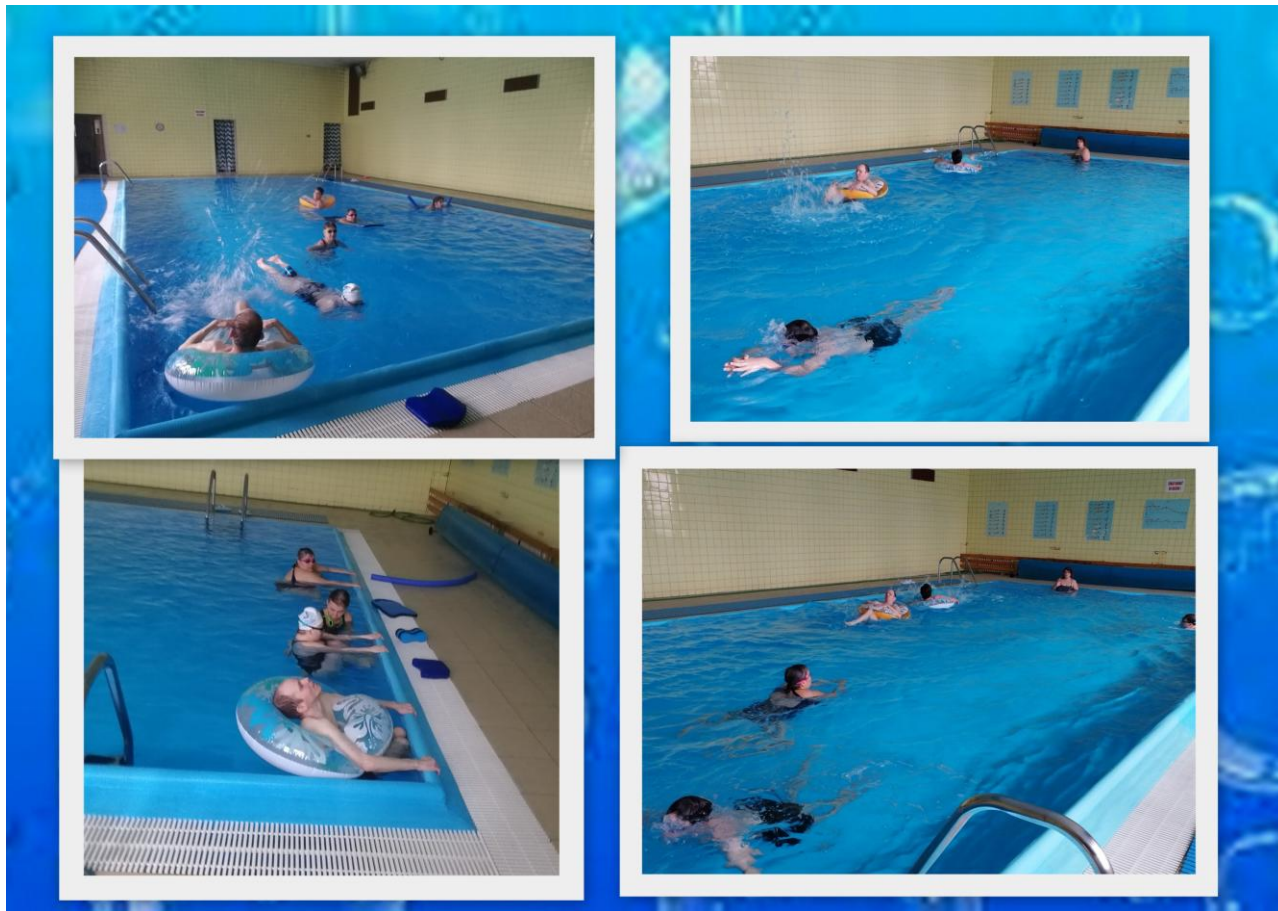
Farbičky - čarbičky Trenčín